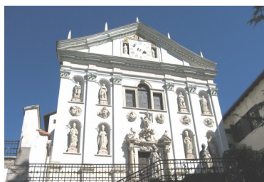
Chiesa di San Michele Arcangelo (San Michele all'Adige - Tn)