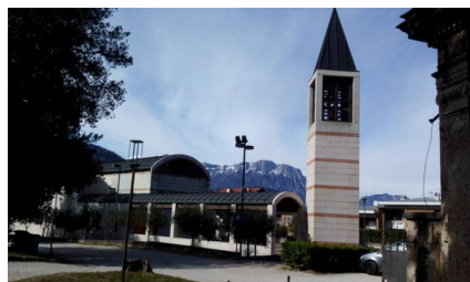
Chiesa di San Rocco (Tn)