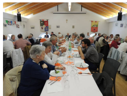
Pranzo al Circolo dell'Associazione ARCA