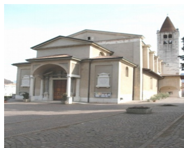
Arcipretale S. Stefano – Mori (Tn)