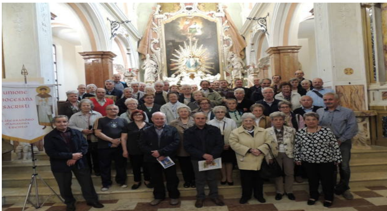
Foto di gruppo al termine della S. Messa nella chiesa Arcipretale S. Stefano