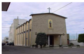
Chiesa S. Antonio (Tn)