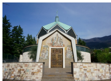
Parrocchia S. Cuore di Trento