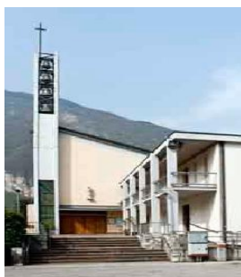
Chiesa San Pio X (Tn)