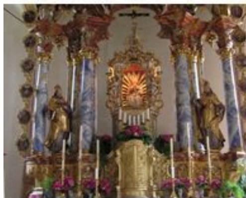
Santuario della Madonna di Senale

Supplemento nr.1 al periodico “Rivista Diocesana Tridentina” nr. 8/16