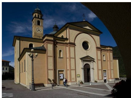
La Chiesa di S. Anna a Montagnaga di Piné

Anno Pastorale Ottobre 2018 – Maggio 2019