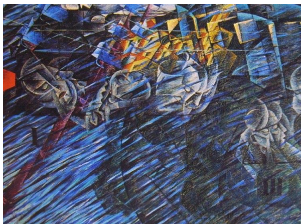
Umberto Boccioni, Quelli che vanno